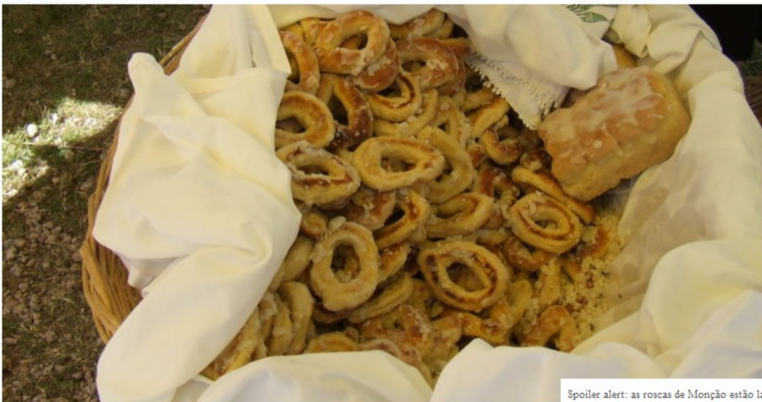
Spoiler alert: as roscas de Monção estão lá.