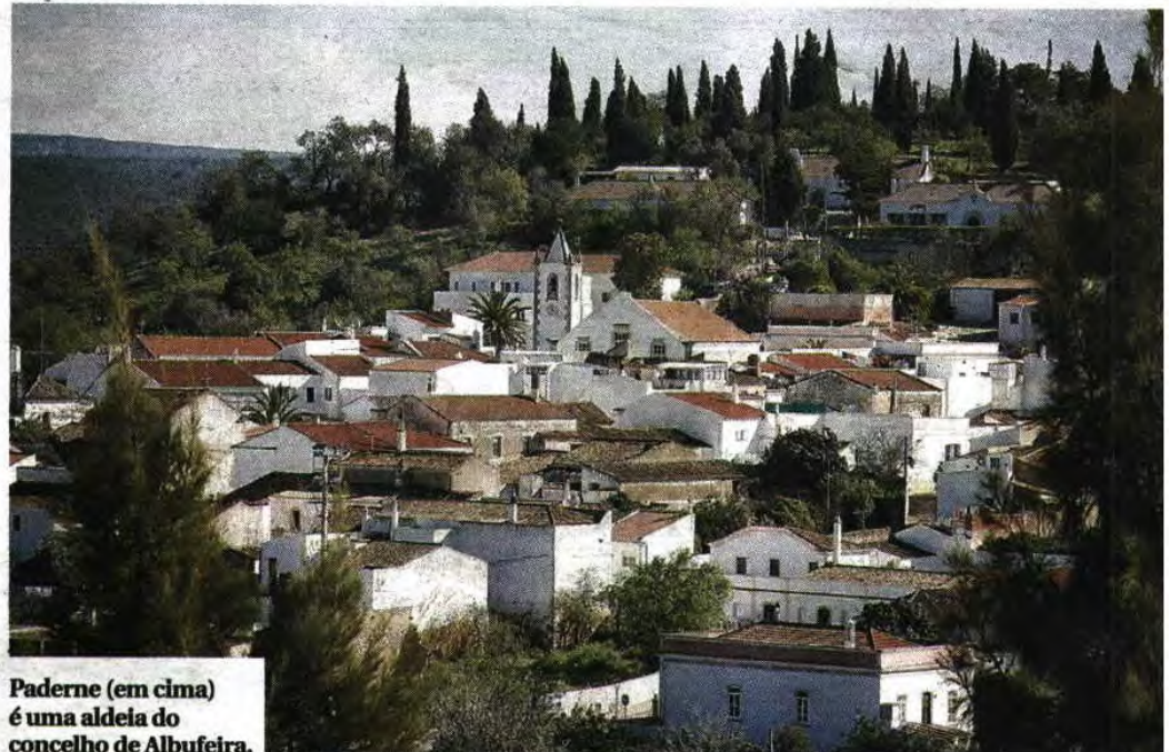
Paderne (em cima) é uma aldeia do concelho de Albufeira, no Algarve. Sistelo (em baixo) pertence ao concelho de Arcos de Valdevez, distrito de Viana do Castelo